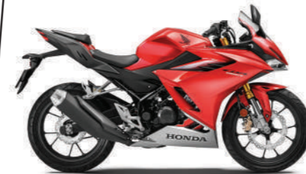
CANDY SCINTILLATE RED