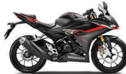
MAT CHARCOAL GRAY METALLIC