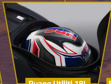
Ruang Utiliti 18L