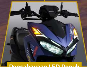
Pencahayaan LED Penuh